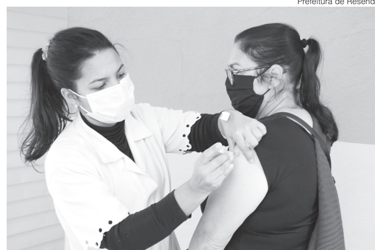
Prefeitura de Resende

Na sexta-feira, dia 30, entre 8h e meio-dia, pessoas acima de 56 anos com comorbidade ou deficiência permanente receberão a segunda dose da AstraZeneca. Estas pessoas, que são cobertas pela ESF, foram imunizadas no dia 7 de maio. No mesmo dia, das 8h ao meio-dia, ainda haverá a aplicação da segunda dose da Coronavac para a população geral a partir de 40 anos, vacinada no dia 9 de julho nas seguintes unidades: na Unidade de Saúde da Família (USF) Cabral/Alambari; USF Engenheiro Passos; USF Fazenda da Barra I; USF Itapuca; e USF Centro. Estes dois grupos deverão levar iden-