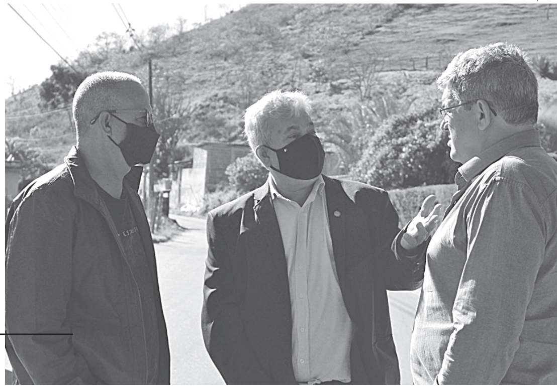
Assessoria de Imprensa