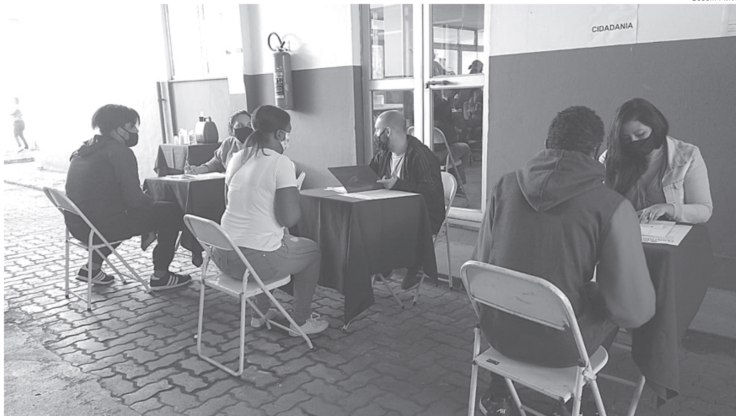
Pessoas foram atendidas individualmente após enfrentarem fila

vem procurar os Centros de Referência em Assistência Social (Cras) mais próximos da residência, além do Centro de Refe-