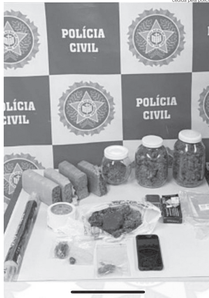
Material estava escondido no quarto do homem e seria alvo de cobiça de outros traficantes