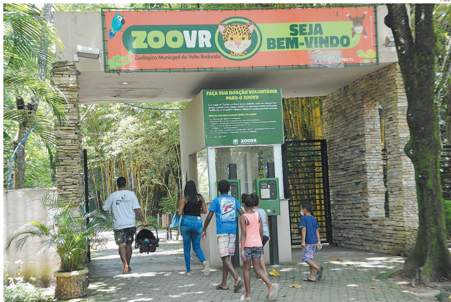
Zoo-VR dispõe de 600 agendamentos para período da manhã e 600 para o período da tarde

- Esta semana a agenda ficou cheia à tarde, embora