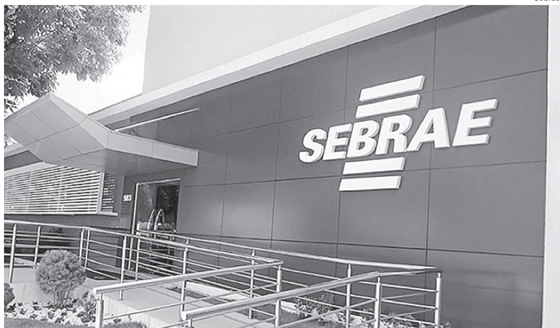
Empresas da Costa Verde terão oportunidade de fornecer para uma das maiores mineradoras do mundo