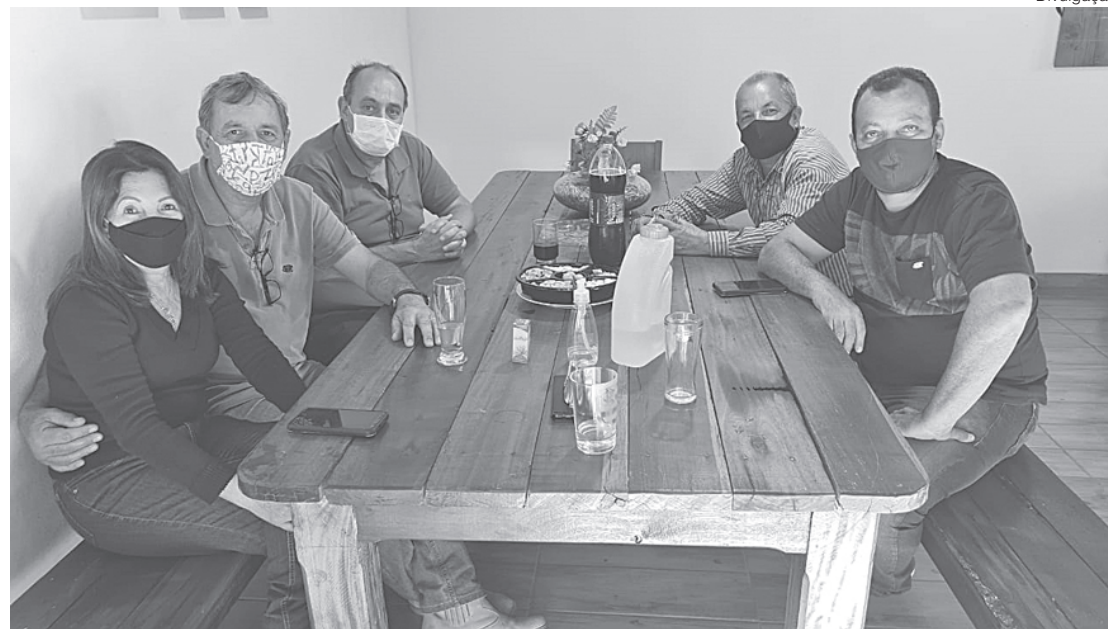
Agenda itinerante aconteceu na sexta-feira, dia 23

"É gratificante saber que o trabalho que tenho realizado como deputado estadual está rendendo bons frutos para impulsionar o desenvolvimento dos municípios do interior e dar mais conforto e segurança aos moradores. A recuperação dessas estradas é fundamental para o incremento da produção agrícola, do turismo e da infraestrutura das cidades para receberem novas indústrias e estabelecimentos comerciais. Por meio de indicações